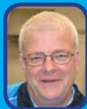
Historique du CTT