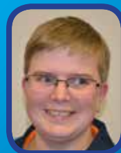
Vente de pâtes, lasagnes, boulettes...