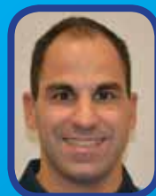
Découverte d'un joueur