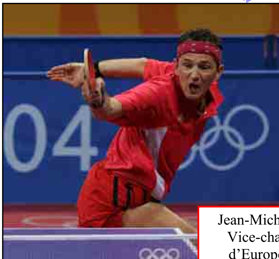
Jean-Michel Saive Vice-champion d'Europe 2005