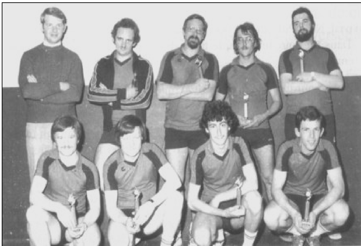
Minerois 1 et Minerois 2 – saison 1979 / 1980