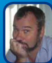
Voulez-vous jouer ?