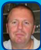
Tournoi du club: les résultats!