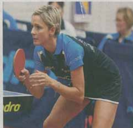
Le club de Minerois a forgé une magnifique perle

La protagoniste nous en parlait. "Je ne me rappelle pas avoir joué comme cela depuis très longtemps, je perds deux sets à zéro et puis je pense que mon adversaire a commencé à stresser, j'étais surmotivée et les supporters présents m'ont bien aidée. Quand j'ai gagné, toute l'équipe a sauté."