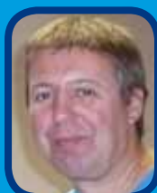
Le Ping, pas un vrai sport ???