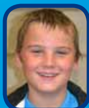
Portrait d'un jeune