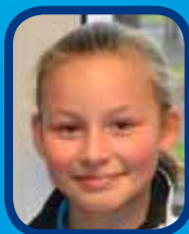
Portrait d'un jeune