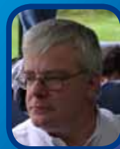
Minerois du mois