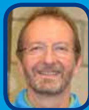
LE DUEL !!!