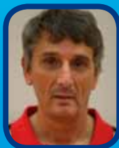
L'histoire d'un club