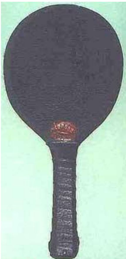
FEATURED BAT: Jacques Leather c.1902