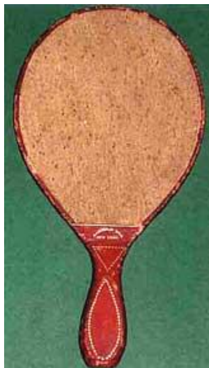
Featured: Cork bat 1902