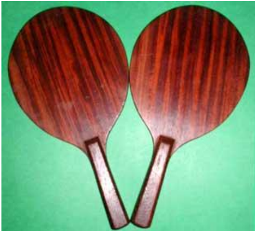
FEATURED BATS: Pair of Mahogany bats, c.1902