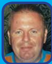
L'inconnu du mois