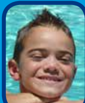
Portrait d'un jeune