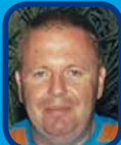
Sourriiez : fin de la série!