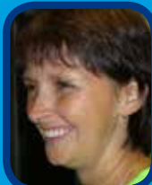
Notre arbitre en activité