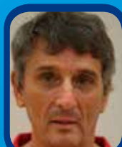
Coacher : 4e partie