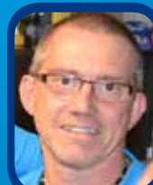
Découverte d'un joueur du club