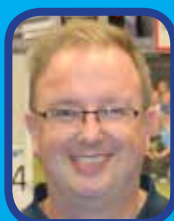
Découverte d'un joueur