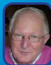
Jeux : solutions