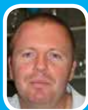
JO de Rio